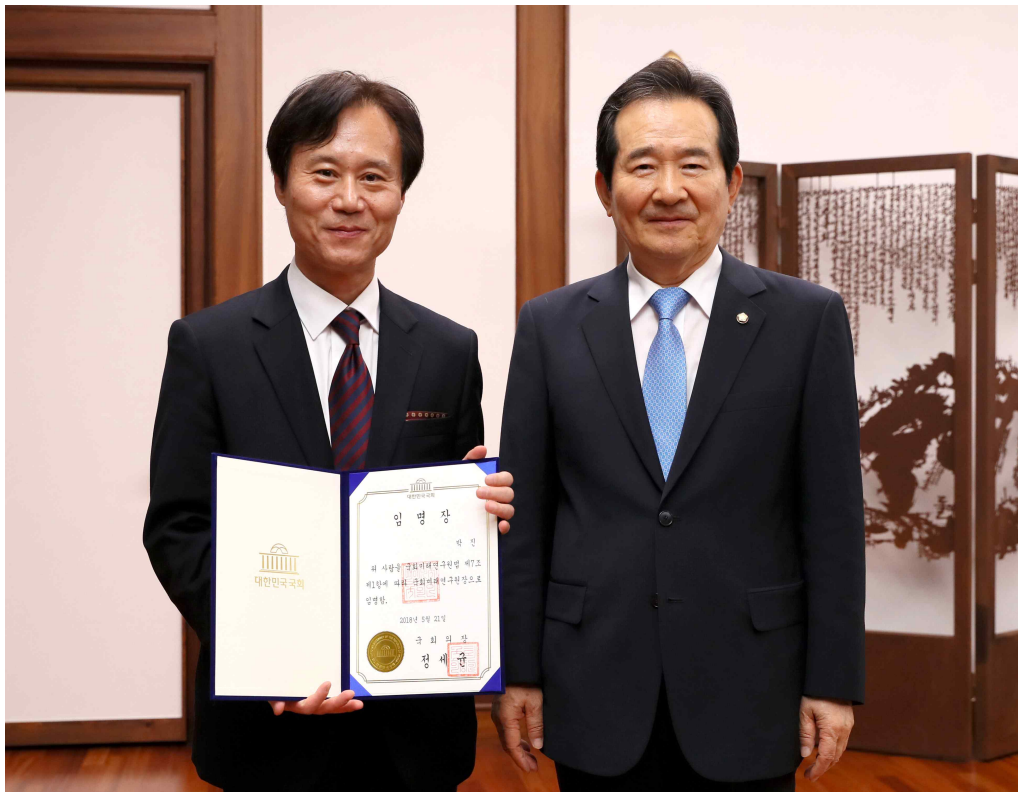
【문 의】 국회사무처 행정법무담당관 김용우, 행정사무관 김형섭(788-3531)