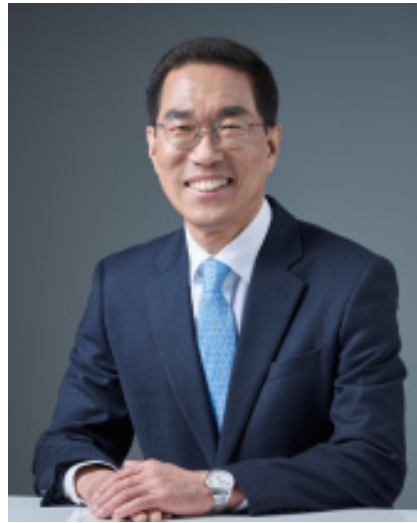
김 주 영 의원 더불어민주당