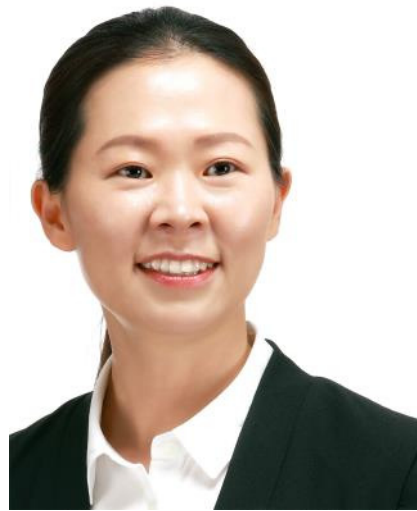
권 은 희 의원 국민의당