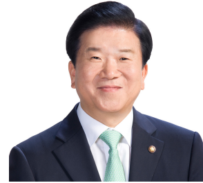
박 병 석 국회의장