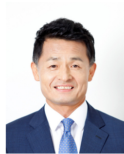
김 현 곤 국회미래연구원장