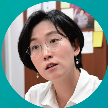
토론 참여의원 정의당 장혜영 의원

※ 코로나-19 확산방지를 위해 현장에는 발제-토론자, 행사 관계자 등 필수인원만 참석예정이며, 유튜브생중계를 이용하시기 바랍니다.